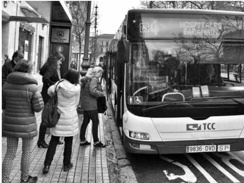
Varios usuarios toman la línea 4, ayer, en el Paseo de Sarasate.

En líneas generales, el transporte urbano comarcal volvió a perder viajeros en 2014, una tendencia descendente que se inició ya en 2008, enmarcada en la crisis económica, pero también en otros factores, como las nuevas formas de desplazamiento y en la pérdida de velocidad comercial de las villavesas. En 2014, el conjunto de la red transportó a un total de 32.711.053 viajeros, 502.364 menos que en 2013. Con estas cifras se ha bajado un nuevo escalón, en este caso el de los 33 millones. Sin embargo, el resultado se refleja de manera desigual en el total de líneas, pero en líneas generales, las rutas más consolidadas pierden viajeros, mientras que las nuevas, las que dan servicio a urbanizaciones más jóvenes, ganan usuarios. Ocurre con la 15 (Paseo de Sasa-